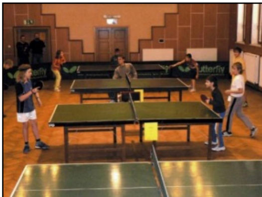
Okresní bodovací turnaj mládeže v Petrovicích